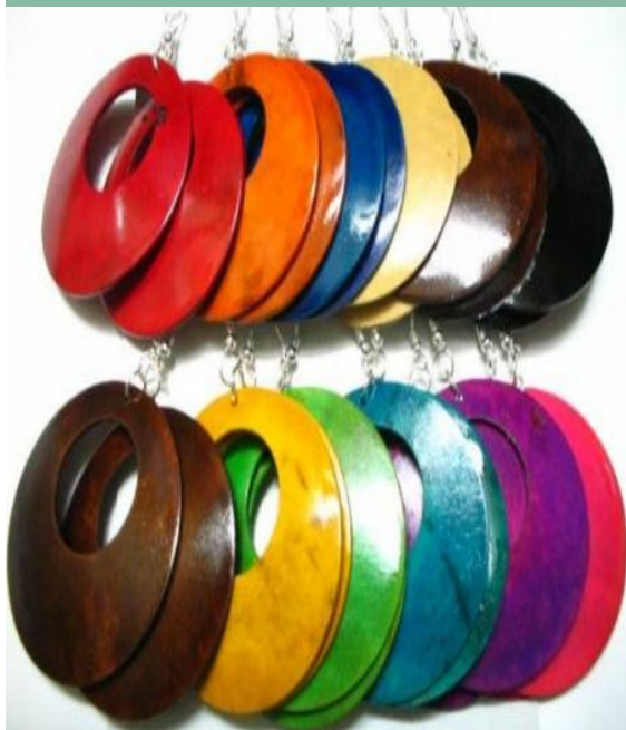
Aretes elaborados en totumo en distintas tonalidades.

Nos caracterizamos por la fabricación diseño y comercialización de bisutería artesanal manufacturada. Todo clase de accesorio para la mujer. (anillos, aretes, collares, relojes, pulseras, tobilleras,